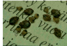
Insectos sobre periódico