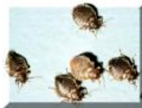
Adulto tamaño real