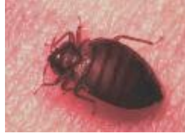
Adulto (fotografía aumentada)