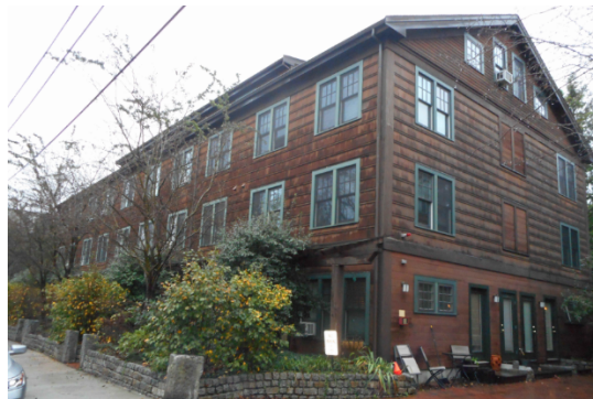
432 Norfolk St. Unidade 2E