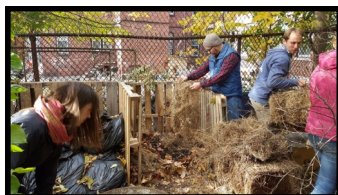
Community Growing Center

Departamentos da cidade, grupos comunitários e moradores podem solicitar financiamento CPA para projetos nestas quatro categorias. A Comissão de Preservação da Comunidade faz recomendações à Câmara de Vereadores para espaços abertos, recreação e projetos de preservação histórica. O Affordable Housing Trust Fund Somerville faz determinações sobre os projetos de habitação. Até agora, em 2015 e 2016, mais de US $ 7,9 milhões foi gasto em mais de 20 projetos. Isso inclui quase US $ 2 milhões em fundos de contrapartida do Estado.