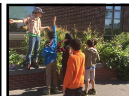
Groundwork school garden