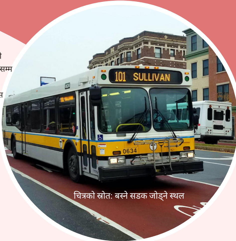
चित्रको स्रोत: बस्ने सडक जोड्ने स्थल